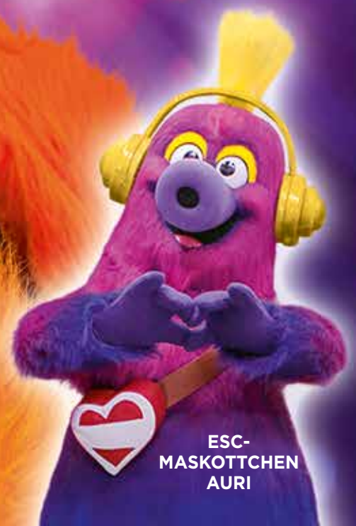
ESC- MASKOTTCHEN AURI

GLANZ UND GÄNSEHAUT ÖSTERREICH IM SONG CONTEST FIEBER