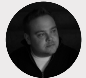
Sepp Moser Fotografiererei Moser