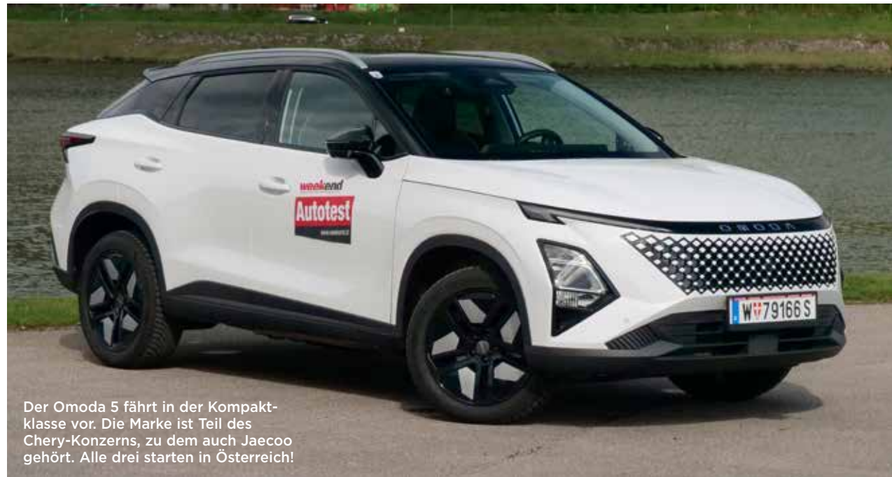
Der Omoda 5 fährt in der Kompakt-Klasse vor. Die Marke ist Teil des Chery-Konzerns, zu dem auch Jaecoo gehört. Alle drei starten in Österreich!